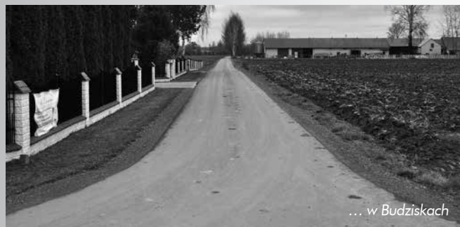
... w Budziskach