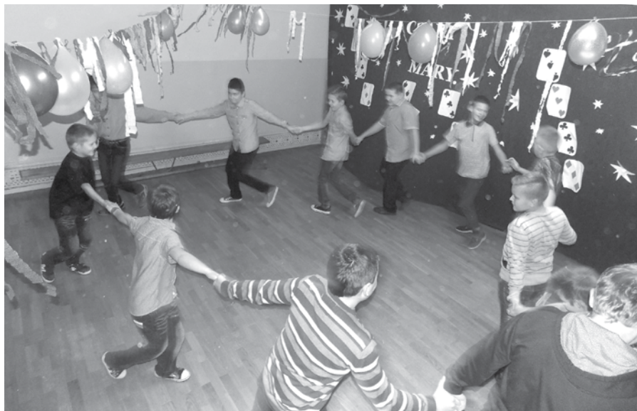
...nogi same rwały się na parkiet