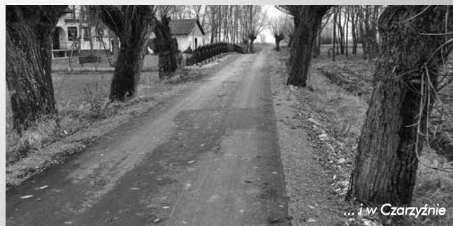
... i w Czarzyźnie