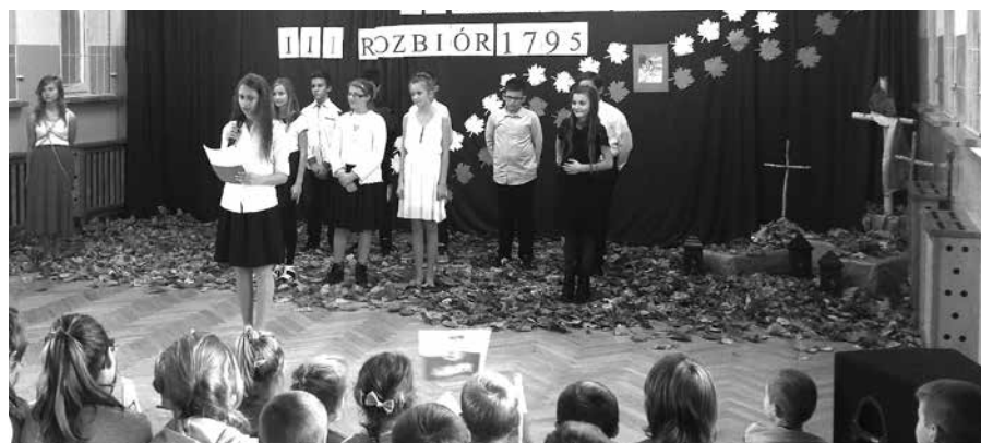
Lekcja historii w wykonaniu uczniów klasy V i VI