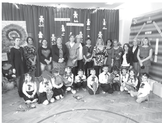
Wspólne chwile po ślubowaniu z wychowawczynią, dyrektorką szkoły i rodzicami