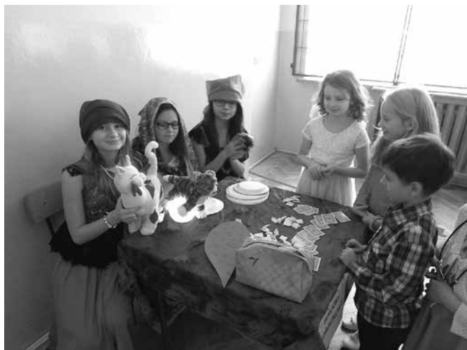
U wróżek czarodziejek

Także w naszej szkole kultywuje się tradycje andrzejkowe połączone z zabawą taneczną. Dnia 26 listopada odbyła się dyskoteka andrzejkowa, podczas której wszyscy uczniowie mieli okazję „poznać swoją przyszłość” dzięki wróżbom przygotowanym przez czarujące wróżki