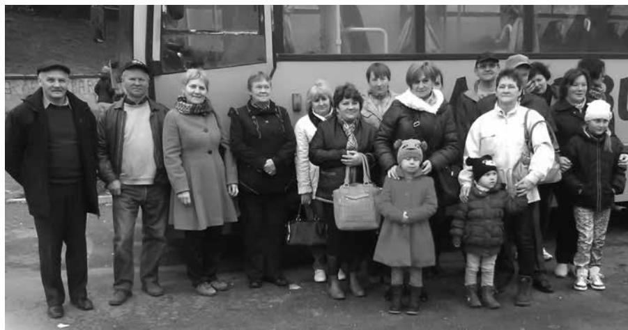
Uczestnicy wyjazdu do Sandomierza

Sołtys oraz Koło Gospodyń Wiejskich ze Słupca zorganizowało wycieczkę do Sandomierza. Oto relacja z odbytej wycieczki.