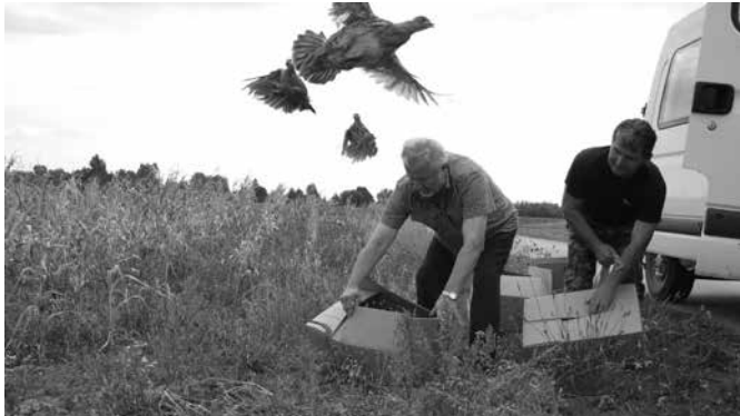
800 szt. kuropatw na wolności...