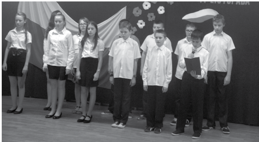
Uczniowie klasy VI podczas akademii