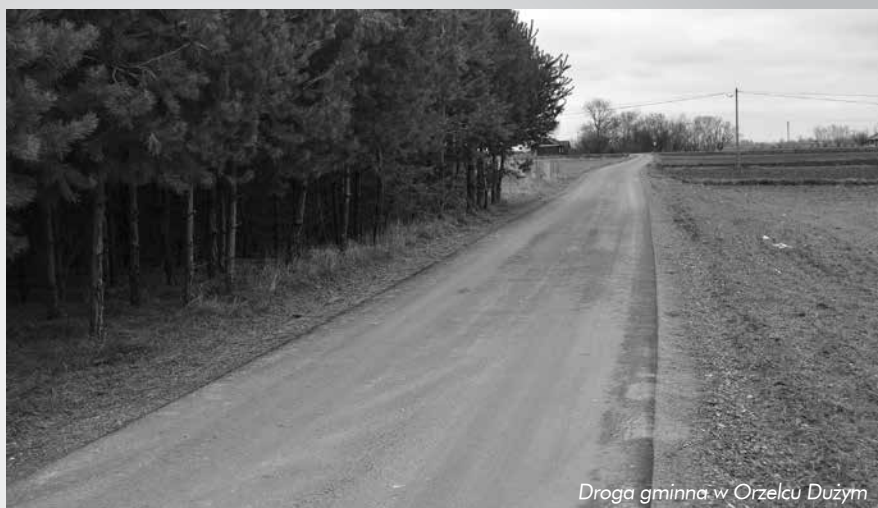
Droga gminna w Orzelecu Dużym