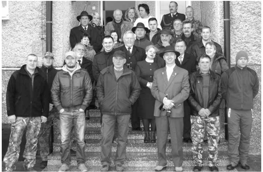
Pamiątkowe zdjęcie przed Klasztorem Ojców Trynitarzy w Budziskach