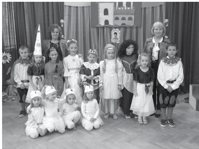
Tuż po balu...