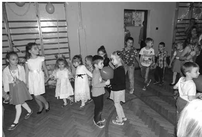
Kibicujemy odważnym parom

i cyganki. Tego dnia było także dużo lanego wosku, buty dzieci maszerowały za próg, a papierowe serce zostało wielokrotnie przebite w celu wyłonienia imienia przyszłego wybranka. Każdy miał szansę wziąć udział w konkursie tańca z balonami, tańca na gazetach, konkursie gorących krzesel oraz w wielu innych zabawach integracyjnych. Rodzice zadbali o to, by na stołach nie zabrakło różnych dań i przysmaków.