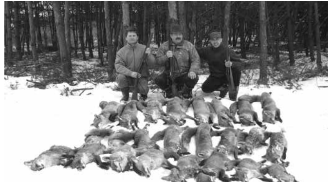
... efekt polowania

stało wiele niedokończonych opowieści, historyjek, jak to zwykle bywa w gronie myśliwych.