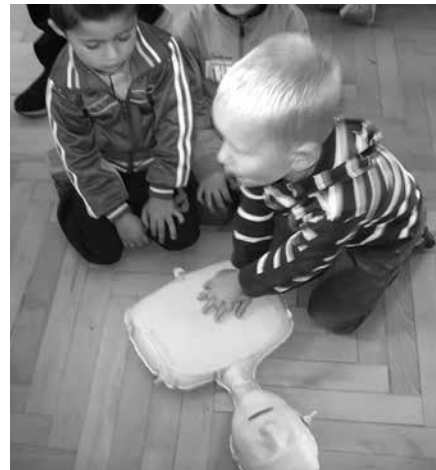
Uczeń klasy „0” udziela pierwszej pomocy

Z przejściem uczniowie rozpoczęli ewakuację z budynku, gdy usłyszeli alarm w szkole oraz zobaczyli zadymienie. Okazało się jednak, że na terenie ktoś jednak pozostał. To jeden ze strażaków doznał „urazu”. Szybko na pomoc podążyli pozostali koledzy. Wynieśli mężczyznę na noszach. Tylko szybka reakcja sprawiła, że nikomu nic się nie stało. Strażacy zadbali o to, by ewakuacja przebiegała sprawnie i zakończyła się sukcesem. Wszyscy w szyku ustawieni na boisku szkolnym oczekiwali na dalszą część zajęć zaplanowaną na ten dzień. Aby uzupełnić wiedzę w zakresie pierwszej pomocy strażacy zadbali o to, by na osobie „poszkodowanej” pokazać, udzielić rad i wskazówek jak postępować w razie wypadku. Kiedy wszyscy zgłębili część teoretyczną przeszliśmy do praktyki. W grupkach pod okiem osób przeszkolonych - strażaków uczniowie uczyli się na manekinach udzielania pierwszej pomocy. Wiedza przyswojona, ale czy już możemy po-