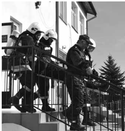
A kogo to niosą? Tak pytali uczniowie

Na prośbę koordynatora bezpieczeństwa w dniu 5 października 2015 r. przybyli do nas strażacy z Ochotniczej Straży Pożarnej z Łubnic.