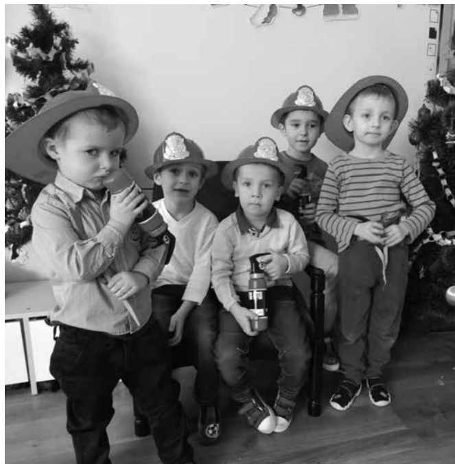
Dzięki św. Mikołajowi jesteśmy gotowi do akcji gaszenia pożaru