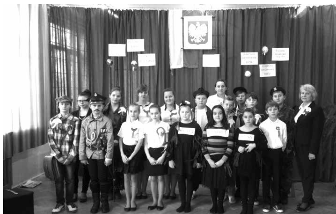
Dopóki pamięć w nas żyje....